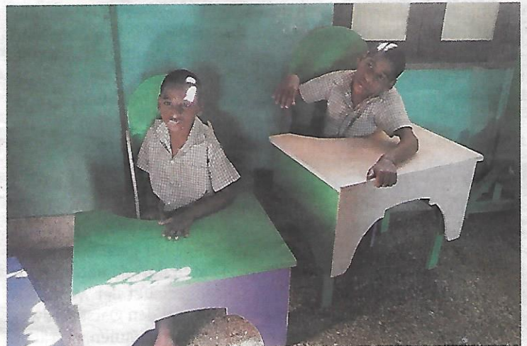
Zwei Buben, die tagsüber in Stühlen fixiert werden. Die beiden Erzieherinnen betreuen bis zu 30 Kinder. Sie können die Kinder nur »verwalten«.