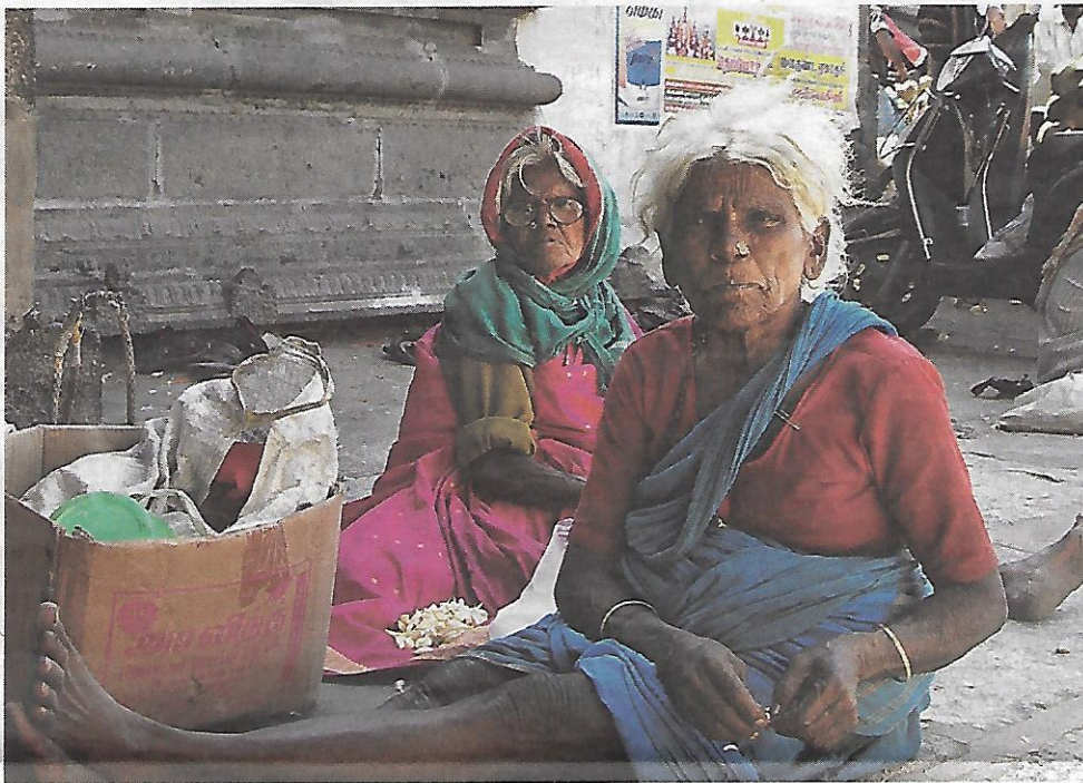
Nicht nur Kindern gilt die Unterstützung der Georg-Kraus-Stiftung, sondern auch anderen Notleidenden in der Welt.