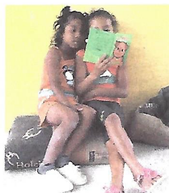
Bildung – auch für Mädchen

Für die Zukunft werden eine hauptamtliche Lehrkraft, ein Mittagstisch für die Kinder, ein Spielplatz und Ausbildungswerkstätten angestrebt.